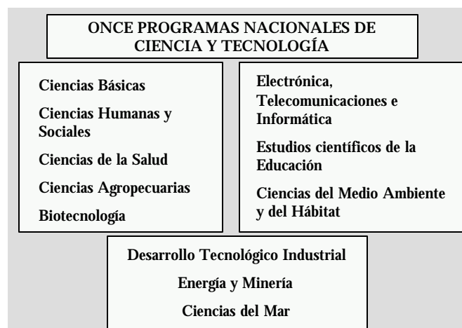
Observatorio Colombiano de Ciencia y Tecnología

Cada uno de ellos depende de un Consejo de Programa, en el que participan el ministro del ramo e investigadores y empresarios que trabajen en el campo correspondiente. Se han hecho ya dos gigantescos procesos de planeación participativa en los que muchos investigadores, académicos y empresarios del país trazaron los planes estratégicos de los once programas. El primero de estos ejercicios tuvo lugar entre 1992 y 1993 y dio origen a una colección de once libros que fueron distribuidos a las bibliotecas de todas las universidades del país. El segundo se realizó entre 1998 y 2000 y los planes estratégicos correspondientes se encuentran en la página web de Colciencias.