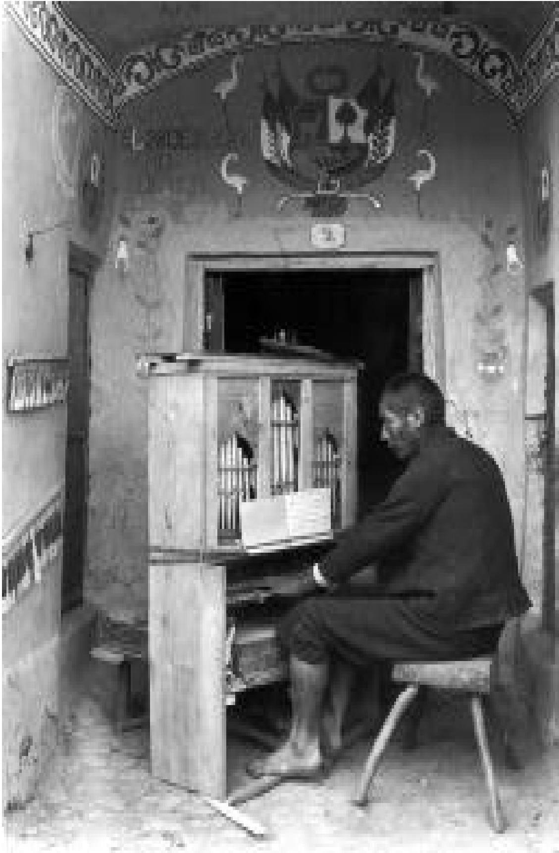
Organista en la Capilla de Tinta. Canchis, 1935