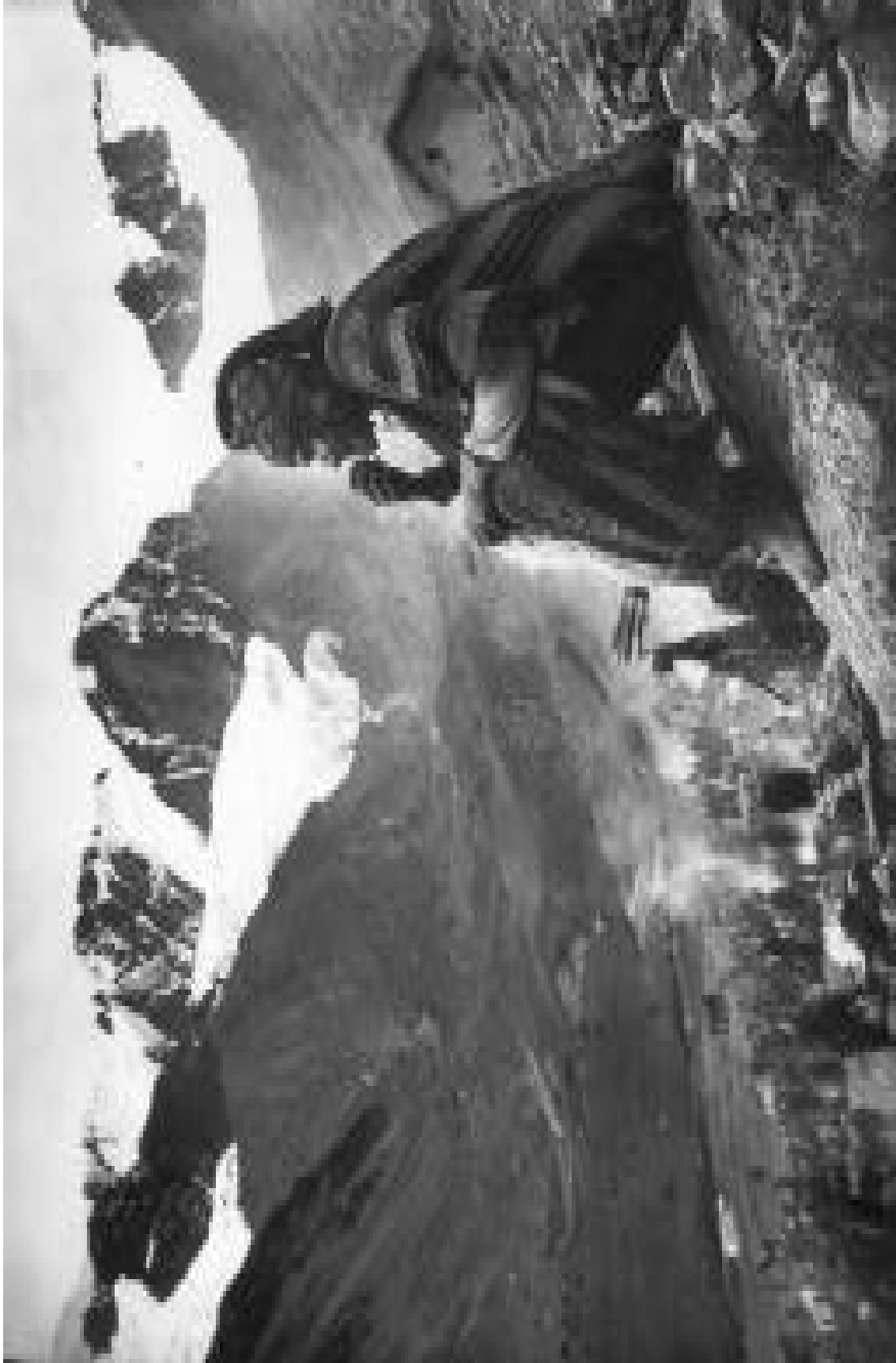
Descanso en Q'Olloriti, 1935