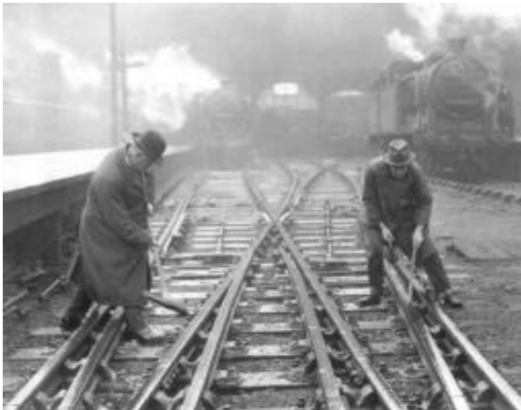
“Esquirols” durante una huelga general ferroviaria. Inglaterra, 1926