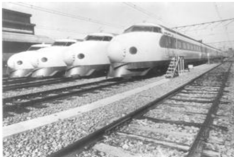
El “tren bala”, durante una huelga. Japón, 1974

Algo similar, me parece, ocurre con estudios poscoloniales. Si uno juzga por los congresos, los debates, los libros y antologías, quién está consiguiendo becas de las fundaciones, etc., parece evidente que el proyecto de estudios poscoloniales está en plena ascendencia. Ahora bien, como se sabe, el campo poscolonial nace en una estrecha vinculación con estudios subalternos: no es fácil decir dónde comienza uno y dónde termina el otro. Pero la coincidencia de los campos no es exacta. Walter Dignolo también estuvo en esa reunión de Ohio State. A diferencia de George Yúdice decidió afiliarse al Grupo, pero con una estipulación clara que ha insistido en repetir después: aunque su proyecto coincidía con el proyecto del grupo, y hasta cierto punto dependía de él, ese proyecto no era el suyo. Para él se trataba más bien de pro-