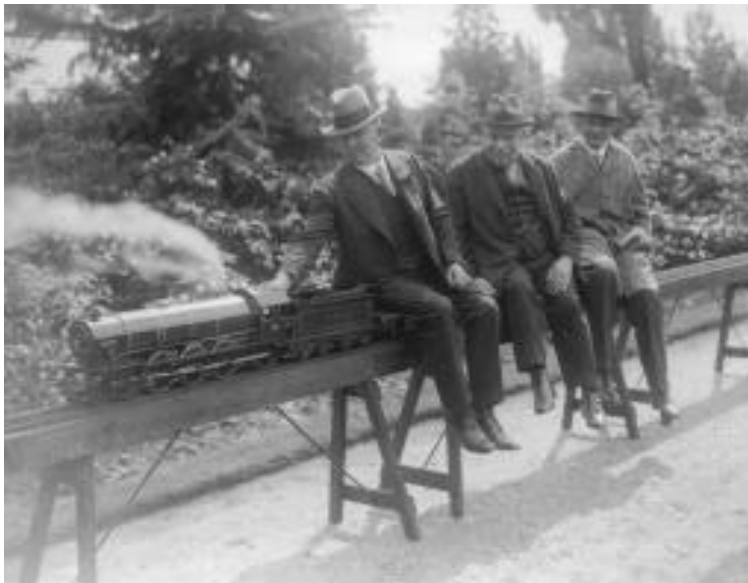
“Tren de pasajeros”. Jugete para niños. Londres, 1927

Lo que compartíamos con estudios culturales era la noción de un desplazamiento de autoridad cultural de la esfera de la alta cultura (“high culture”) -representada para nosotros por el canon de las literaturas nacionales- hacia un sujeto popular heterogéneo y multifacético. Nuestro impulso fue identificar ese sujeto con lo que entendíamos por el concepto de lo subalterno. Pero García Canclini y otros involucrados en la articulación del paradigma de estudios culturales veían a la dicotomía subalterno/hegemónico como anacrónica, debido a su dependencia en la dicotomía modernidad/tradición, sobrepasada por la urbanización y los efectos culturales de la globalización económica y comunicacional en América Latina. Para García Canclini, como se sabe, la dinámica de las culturas populares consiste en