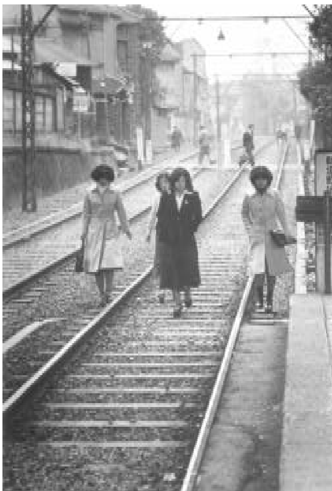
Huelga de trenes. Japón, 1975

Lo que me gustaría que sobreviviera del Grupo es esta ética de sospecha sistemática. Todos nosotros estamos de una forma u otra conscientes de enfrentar una paradoja en lo que hacemos. Lo que comparten estudios subalternos, culturales y poscoloniales y, aunque de una forma diferencial, la crítica cultural, es un deseo de desarraigamiento cultural. Este deseo nace evidentemente-