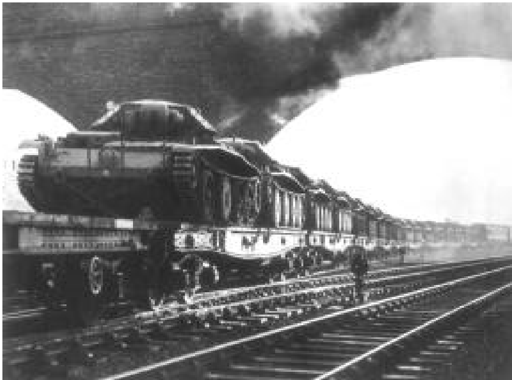
El tren, un transporte eficaz. 1940

actores sociales que permite la sociedad de mercado, un juego de diferencias no sujeto en principio a una dialéctica de amo y esclavo, porque cada uno procura maximizar su ventaja y minimizar su desventaja, sin obligar al otro que ceda sus intereses y sin atender necesariamente a la autoridad hermeneútica de intelectuales o estamentos culturales de izquierda o de derecha. Creo que este hecho explica en parte por qué el neoliberalismo a pesar de sus orígenes en una violencia contra-revolucionaria, ha llegado a ser una ideología hegemónica y no sólo dominante: es decir, una ideología en que personas de clases o grupos subalternos pueden ver también cierta posibilidad para sí mismos. Por contraste, en algunas de sus variantes más conocidas -pienso por ejemplo en el modelo voluntarista del “hombre nuevo” de