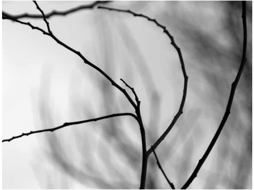
FOTOGRAFÍA DE JUAN MANUEL BAUTISTA F.

Ahora bien, “Conrad parece estar diciendo: nosotros los occidentales decidiremos quién es un buen o mal nativo, porque los nativos tienen existencia únicamente en virtud de nuestro reconocimiento, los hemos creado, les hemos enseñado a hablar y a pensar y cuando se rebelan, lo que hacen es sencillamente confirmar nuestra visión de ellos como simples niños” (Said, 1996: 25). Para Said, escritores como Conrad, representantes de la alta cultura, personas ilustradas y “cultivadas” si las había, cumplen una doble función, pues al tiempo que caracterizan al “nosotros” (los europeos civilizados mayores de edad) y a los “otros” (los no europeos), justifican el ejercicio de poder y la dominación al ensalzar la cultura propia y presentar a esos “otros” como bárbaros ingobernables, o, en el mejor de los casos, como niños carentes de gobierno; lo cierto es que los (re)presentan y construyen como “sujeto de una culpable inmadurez. De manera que la dominación (guerra, violencia) que se ejerce sobre el Otro es, en realidad, emancipación,