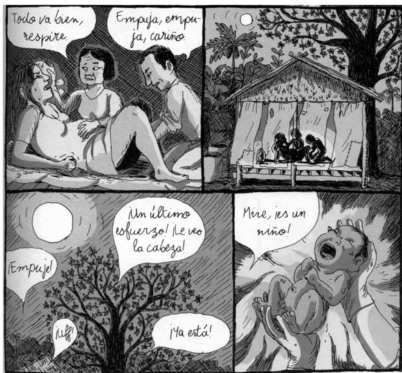
Tian | TOMADA DE EL AÑO DEL CONEJO, NOVELA GRÁFICA | EDICIONES SINS SENTIDO

sinistro en la figura de la “trata” y la “desaparición” en la consigna de la Marcha: los significantes alegría callejera vienen a designar de una manera elíptica y poética a los/as jóvenes que nos faltan a los cordobeses porque han desaparecido sin saber hasta el momento nada de ellos 18 , sospechando que han sido víctimas de gatillo fácil 19 o de la trata de personas. Astutos y sutiles juegos de palabras, resistencia en lo cotidiano (Scott, 2003), frente a la incertidumbre, el dolor y la muerte.