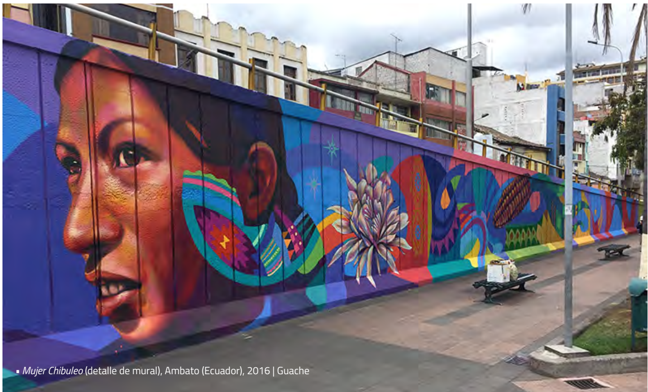
▪ Mujer Chibuleo (detalle de mural), Ambato (Ecuador), 2016 | Guache

Sin embargo, qué tan articuladas, intencionadas o estratégicas son estas acciones, merece mayor discusión. No se trata sólo de una reacción antagonista, como sugiere el uso de conceptos como movimientos antide-rechos o antigénero , pues hay en tales movilizaciones un interés en producir nuevas políticas del género y la sexualidad, y un recurso a discursos de derechos. Sin embargo, como encontró la investigación que soporta este artículo, para el caso de los usos políticos de la homofobia, la decisión de desplegar tales iniciativas puede llevar a efectos diferentes a los planeados. La politización de la homofobia se usa en una variedad de situaciones, y obtiene resultados diferenciados, ambivalentes e incluso inesperados. Así, es necesario revisar atentamente la noción de intención que subyace en las conceptualizaciones que hacemos de estas movilizaciones y estrategias políticas. “Ideología de género” puede ser desplegada en la retórica de proyectos políticos autoritarios y totalitaristas, pero su mera presencia no implica resultados directos en las políticas del género y la sexualidad, pues depende de una variedad de