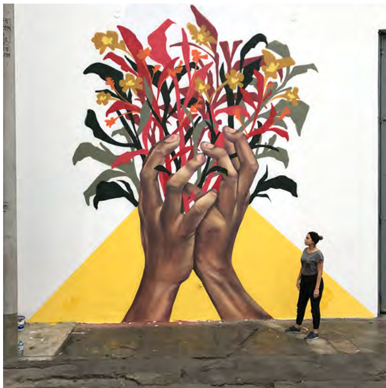
■ Sin título, Lima (Perú), 2016 | Pésimo

Sin embargo, en países que han experimentado conflictos sociopolíticos prolongados, una parte del poder estatal es también ejercido en paralelo o está en disputa por actores paraestatales