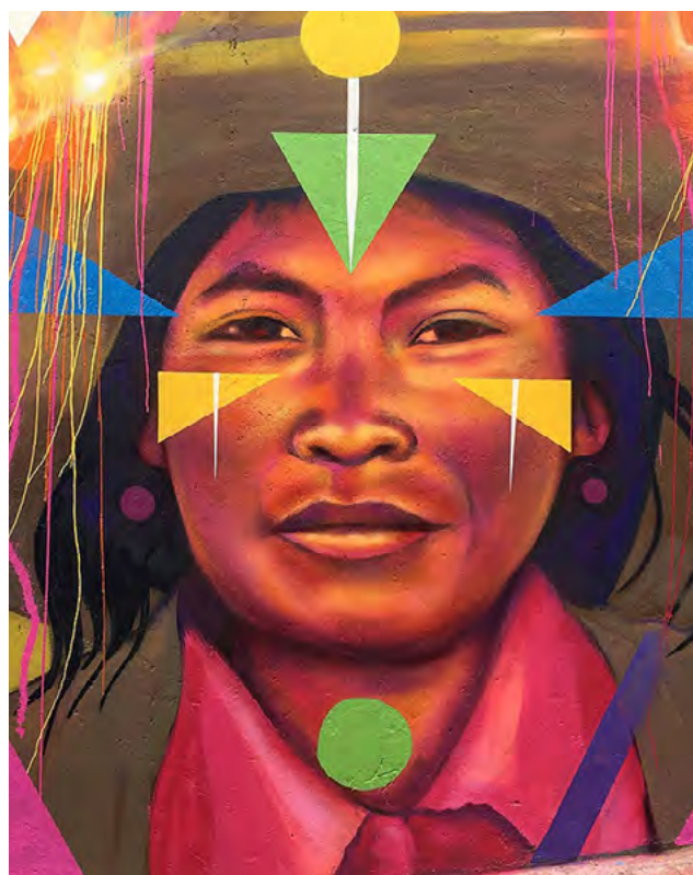
■ Sin título , basado en una foto de Lucas Rodríguez, Barrio La Concordia, Bogotá (Colombia), 2018 | Guache

Así, sugiero observar la emergencia de "ideología de género" en Colombia como un mecanismo para obtener poder político que surge, se nutre y hace parte de las políticas del género y la sexualidad menciona-