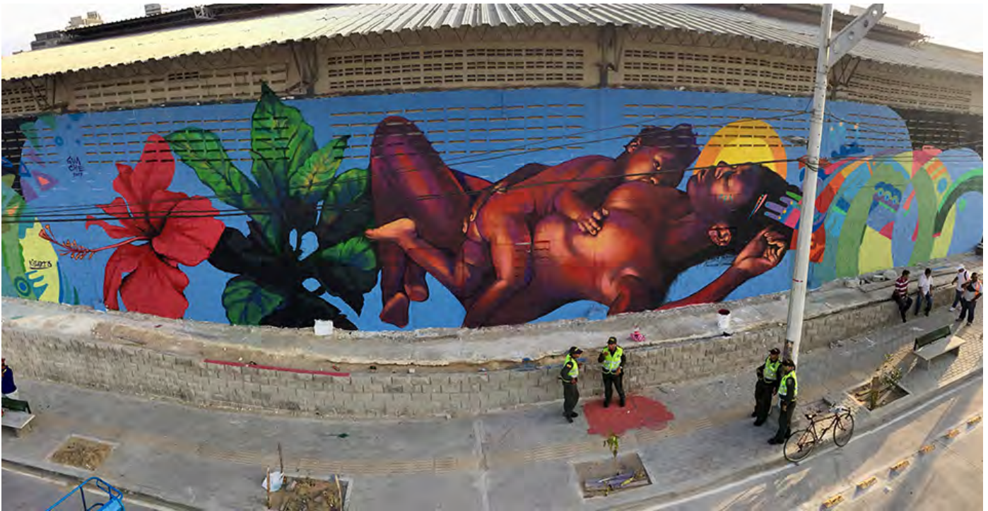
■ Cayena , mural finalizado para el Killart Festival, inspirado en una foto de Jade Beall, Barranquilla (Colombia), 2017 | Guache

Es en un contexto de transición o leído como en permanente crisis, que la politización de la homofobia resulta de utilidad para proyectos autoritarios como los que recurren a “ideología de género” como argumento de legitimación. La homofobia, como forma de violencia sexual y de género, y de manera más amplia, las violencias contra lesbianas, gais, bisexuales y personas transgénero en contextos de transición política ha sido estudiada en relación con movimientos de liberación en Namibia (Currier, 2010) y países de sur de África (Epprecht, 2005); como parte de resistencias al ingreso a la Unión Europea en Polonia (Graff, 2010); en el autoritarismo y macho politics de Rodrigo Duterte en Filipinas (Evangelista, 2017); o en procesos nacionalistas en Indonesia (Boellstorff, 2004), Serbia (Greenberg, 2006), Kosovo (Krasniqi, 2007) y Croacia (Zarkov, 2001). En estos estudios se entiende la homofobia como un elemento clave en las luchas políticas que caracterizan las transiciones políticas.