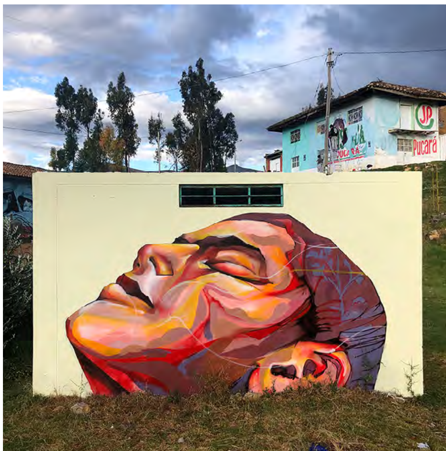
▪ Sin título, Festival Despierta, Huancayo (Perú), 2019 | Pésimo

América Latina, permite ver ritmos contradictorios de cambio. Un ejemplo lo constituye el caso argentino donde, a pesar de la influencia de la Iglesia católica, se han dado transformaciones en temas de diversidad sexual pero resistencias en asuntos como el aborto (Pecheny et al. , 2016). Casos como los de Colombia o Brasil, donde han sido iglesias pentecostales con presencia en partidos políticos quienes lideran el tema de “ideología de género”, merecen ser abordados desde dimensiones políticas no explicadas tan sólo en discusiones teológicas o de influencia vaticana.