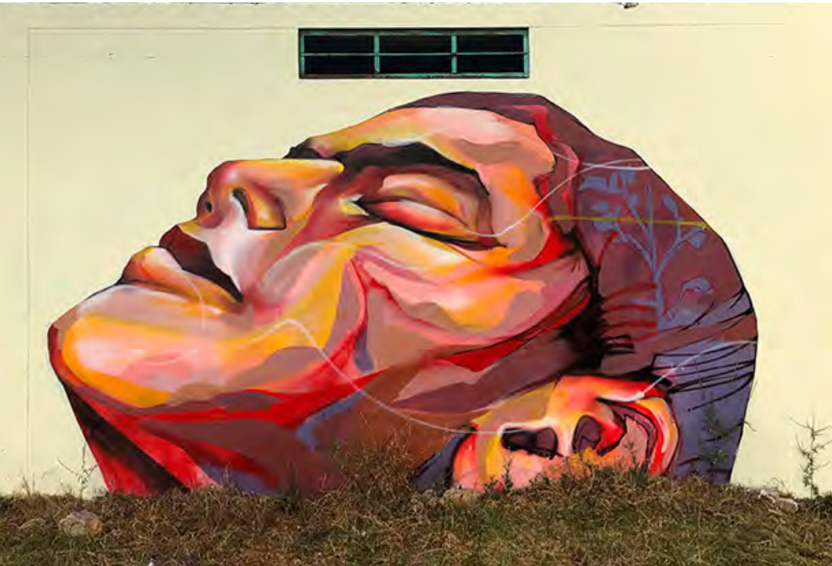
▪ Sin título , Festival Despierta, Huancayo (Perú), 2019 | Pésimo