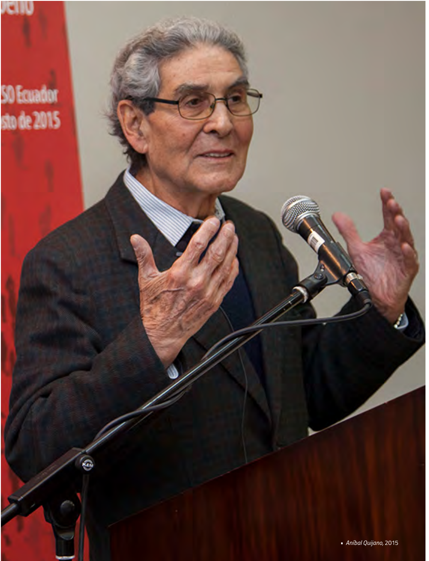
▪ Aníbal Quijano, 2015