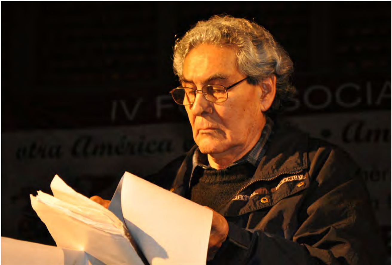
■ Aníbal Quijano, 2011

por develar la temática de la integración social y de los problemas sociales: “el obrero industrial”, “la prostitución”, “las pautas de migración”, etc. (Mejía, 2005: 311)