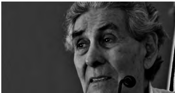
■ Aníbal Quijano, 2018