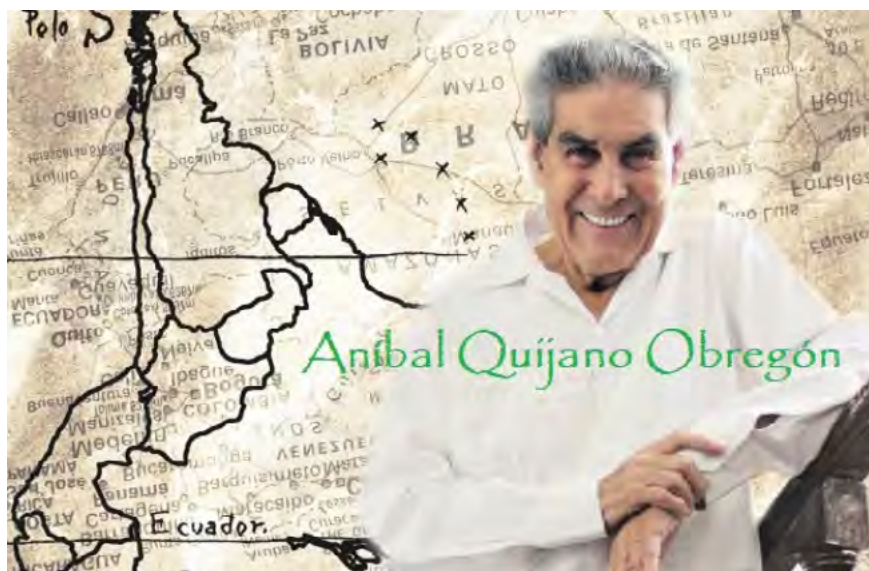
▪ Aníbal Quijano, 2011