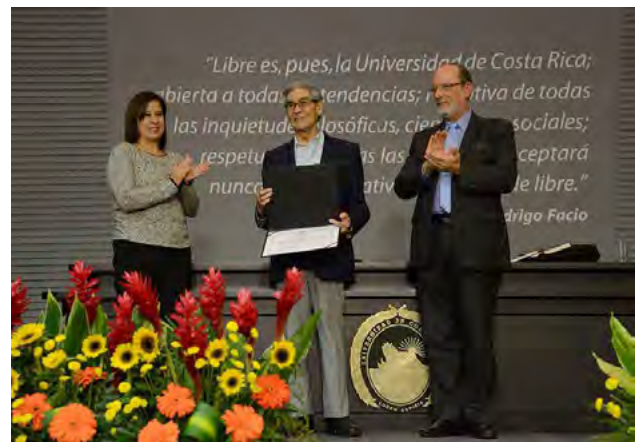
■ Aníbal Quijano, 2015 | Universidad de Costa Rica le otorga el Doctorado Honoris Causa.

Aunque, a mi parecer, Quijano no logra ver la profundidad de la relación que hay entre la novelística de Arguedas y sus textos antropológicos, los cuales conocía, pues llega a citarlos en el libro Dominación y cultura , no estaba equivocado en pensar que una visión culturalista y romantizada de lo indígena entendiese un aspecto puramente cultural en donde el conflicto y el cambio social apuntaban la lucha por la transformación de la dominación cultural y social de los indígenas.