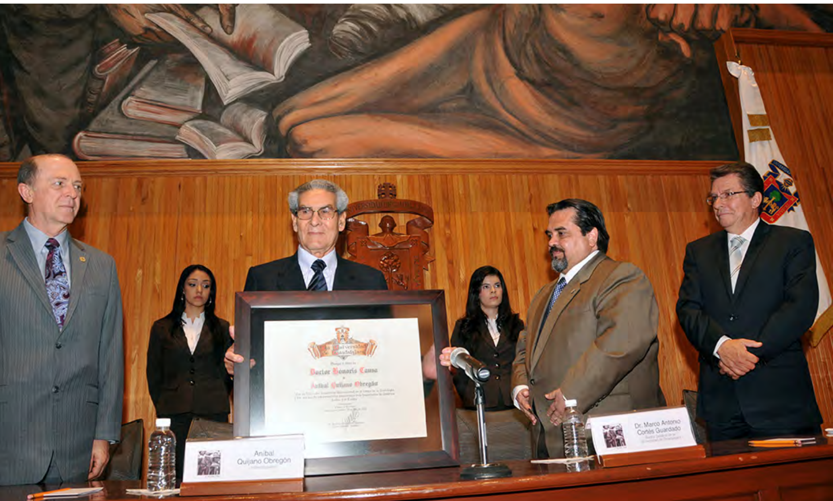
■ Anibal Quijano, 2005 | Universidad de Guadalajara le otorga el Doctorado Honoris Causa.

En consecuencia, una de las tareas que no pueden dejar de cumplir en esta etapa los científicos sociales, en algunos de nuestros países, tiene que ser la elaboración de enfoques teóricos, organizados como sistemas de hipótesis de trabajo, con vistas a su verificación empírica. Esto es, estrictamente hablando “ensayo”. Pero se diferencia radicalmente del tipo de “ensayo” característico de la época anterior latinoamericana, en que se formula en tanto que un conjunto de hipótesis científicas, destinadas directamente a la investigación empírica. (Quijano, 1980: 50)