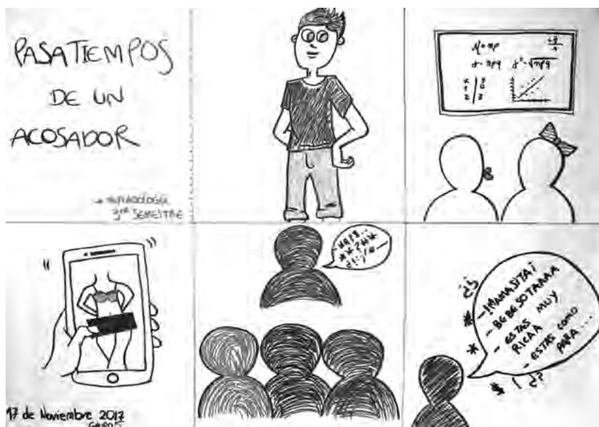
Imagen 3. Taller 14, estudiantes Facultad de Ciencias Administrativas, Económicas y Contables (FCAEC), 2017