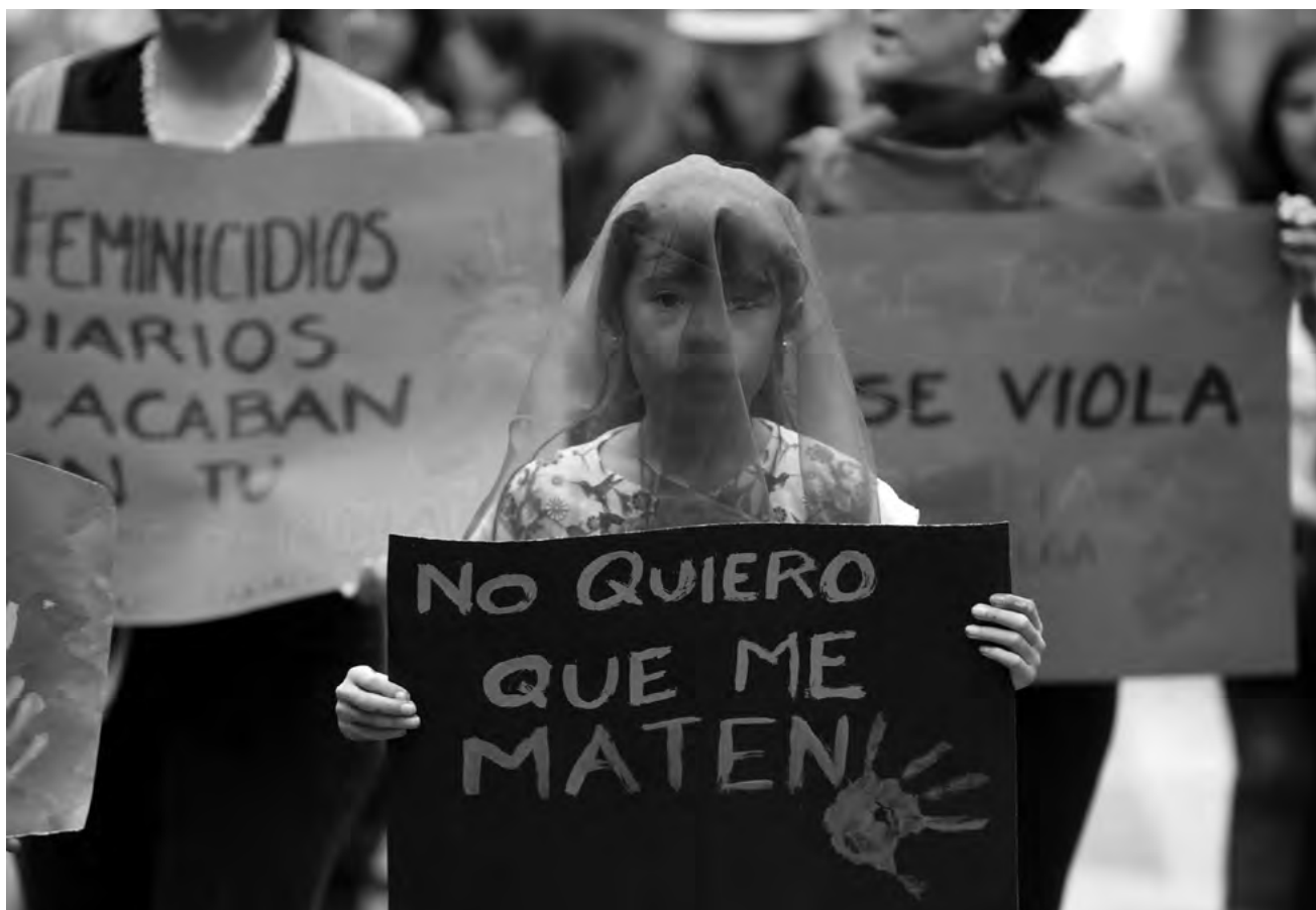
▪ Mexicanas marchan contra el feminicidio, marzo del 2019

docentes y el 10% de estudiantes en la Universidad de Antioquia, siendo un estudio pionero en el campo (Fernández et al. , 2005). La Universidad de Caldas registró 18,4% de actos de violencia sexual en las estudiantes, de éstos, 84 casos (16,7%) fueron de acoso sexual y 8 de violación sobre un total de 950 estudiantes encuestadas (Moreno et al. , 2007). En otro estudio realizado por Moreno, Sepúlveda y Restrepo (2012) en la misma institución, con 398 personas, el 26,9% informó burlas, piropos o gestos obscenos. Llama la atención que el acoso sexual fuera reportado solamente por el 4,5% de los/as docentes y por el 2,7% del estudiantado, lo que difiere de los hallazgos de la pesquisa del 2007 de las mismas autoras 11 . En el 2012 no se presentaron casos en el personal administrativo.