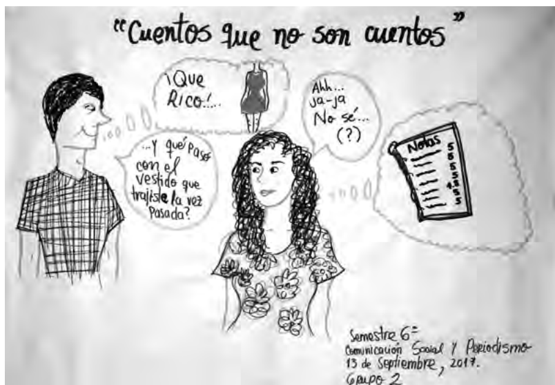
Imagen 2. Taller 4, estudiantes de Comunicación Social y Periodismo, 2017