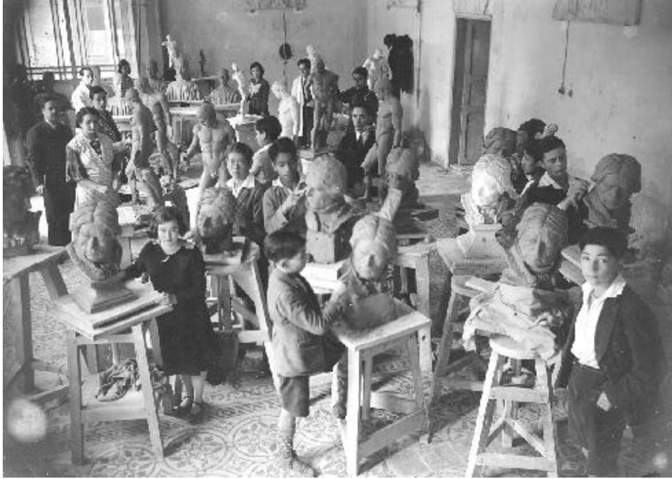
Clase del escultor Gustavo Arcila en la Escuela de Bellas Artes de la Universidad Nacional de Colombia, 1936.

producto del carácter comunicativo-educativo que éstas le imprimen a sus prácticas de gestión cultural, atrajeron poderosamente la atención de los investigadores del IESCO, a saber: Colectivo de Comunicaciones Montes de María Línea 21 (CCMMA), Asociación de Vecinos Solidarios (AVESOL) y Promotora Cultural Zuro-Riente.