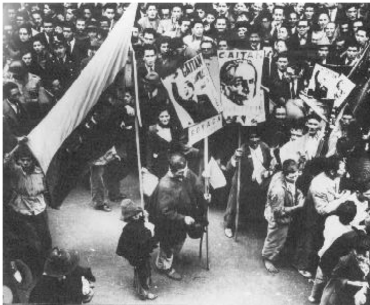
Manifestación gaitanista en Bogotá.

do a la gente a re-conocerse entre sí y a sí mismos, a través del arte y la cultura. Por supuesto, más allá del interés por aculturizar territorios con arreglo a criterios hegemónicos, fue más bien claro que en estas organizaciones se imponía el deseo de “activar lo que en el público hay de pueblo” (Martín-Barbero, 2003: 309), de suerte que el encuentro por el cual empezaron a propender sus múltiples acciones se convertía en un “lugar” que posibilitaba “la experimentación cultural, la experiencia de apropiación y de invención,