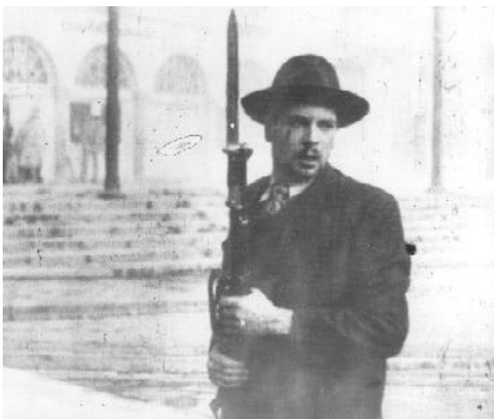
9 de abril de 1948 en Bogotá.

De esta forma, dichas organizaciones toman conciencia y terminan