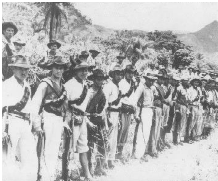
Levantados en armas en el campo colombiano.

En ese orden de ideas, el escrito alude, en primer lugar, a la complejidad que reviste todo ejercicio investigativo cuando de observar la realidad se trata. Asunto cuyas tensiones se hacen aún más evidentes en un trabajo etnográfico que