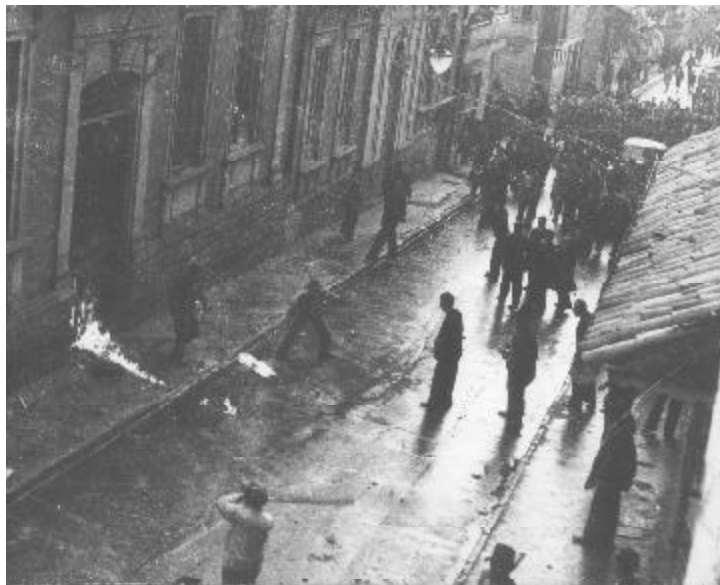
9 de abril de 1948 en Bogotá.

Al principio de las charlas con las organizaciones populares, recuerdo, me sentí sumamente tentado por designar, amparado en la academia, la realidad que me describían los actores sociales a través de una meta-narrativa cuidadosamente elaborada. No obstante, mi pretensión co-investigativa, cuyas implicaciones me hicieron recordar la importancia de no ejercer una “ofensiva” epistémica sobre el otro, con el fin de construir un diálogo experiencial (Huerco, 2002) y fomentar así un proceso de negociación tendiente a facilitar, sin arreglo a un sistema for-