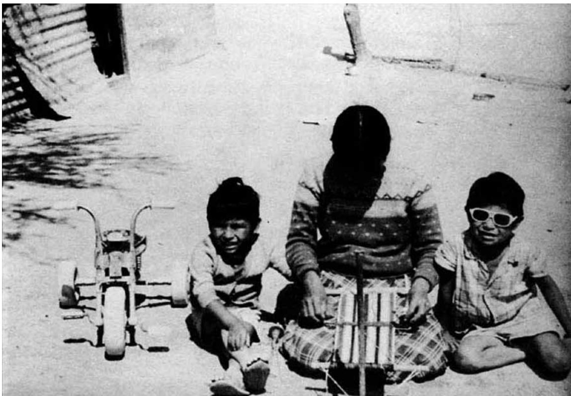
FIGURA 3. MUJER AYMARÁ CON SUS HIJOS, TEJIENDO UNA “TALEGA” TRADICIONAL SOBRE LA TIERRA ARENOSA DE SU PARCELA DEL FUNDO EL REFRESCO