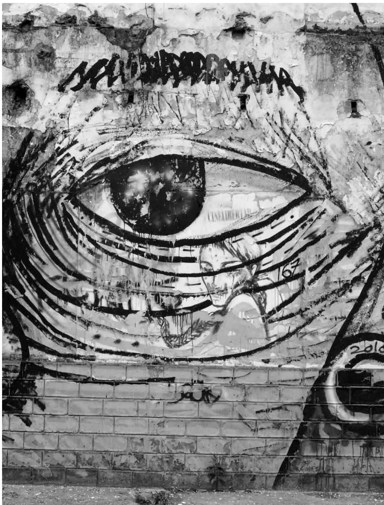
Lo mirado