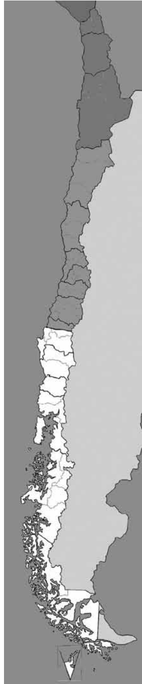
FIGURA 1. MAPA REGIONAL DE CHILE. SE DESTACAN: EN BLANCO, EL SUR, EN GRIS OSCURO, EL NORTE. EL ÁREA SEPTENTRIONAL CORRESPONDE AL ACTUAL NGC GEOPOLÍTICO

Entenderé en este artículo el Norte Grande de Chile como un “lugar etno-