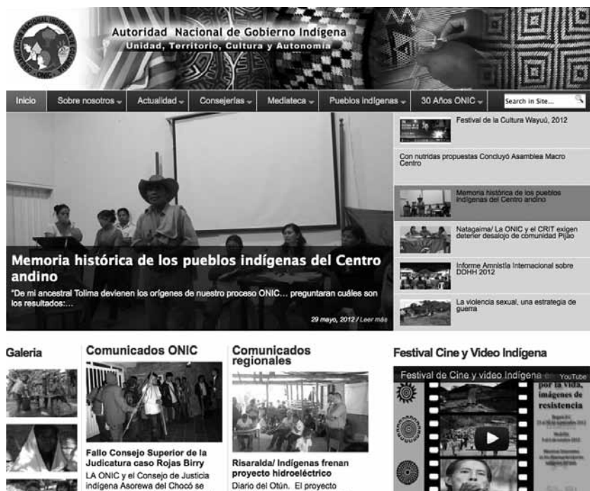
PÁGINA WEB DE LA ONIC

Gracias al trabajo realizado en Narratopedia a partir de la experiencia de trabajo colaborativo y al desempeño de acciones centradas en la creación conjunta, el panorama de trabajo para