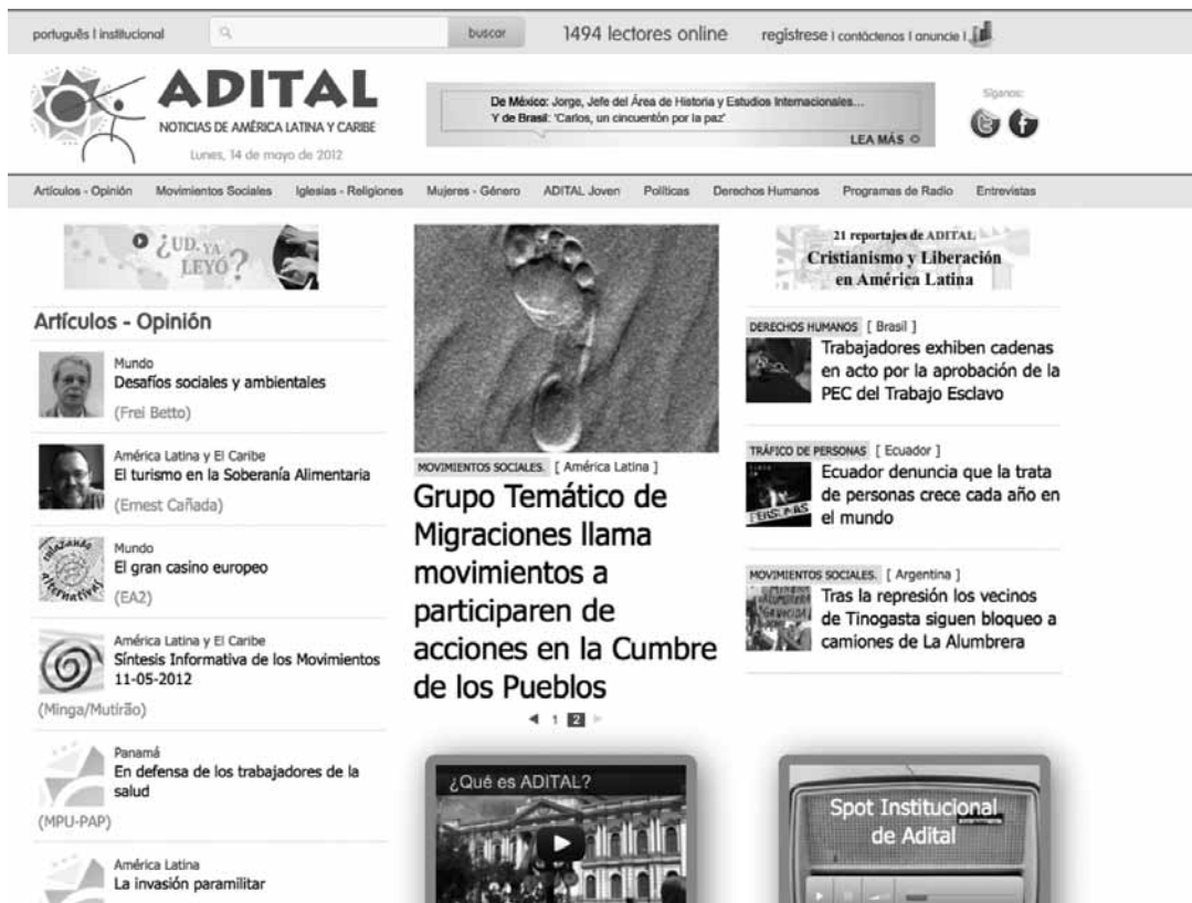
PÁGINA WEB DE ADITAL NOTICIAS

sultado de todo esto fue un artículo bastante completo que, sin embargo, quedó expuesto para su perfeccionamiento y posterior publicación en la plataforma Wikipedia en español.