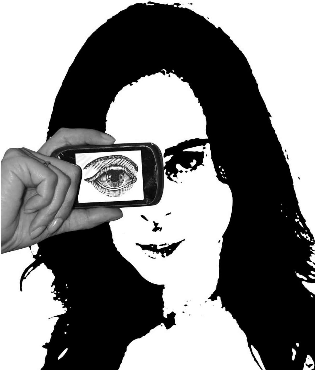
ILUSTRACIÓN | DANIEL FAJARDO B.