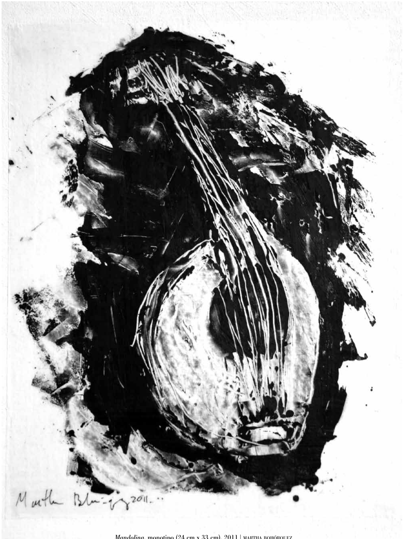
Mandolina , monotipo (24 cm x 33 cm), 2011 | MARTHA BOHÓRQUEZ