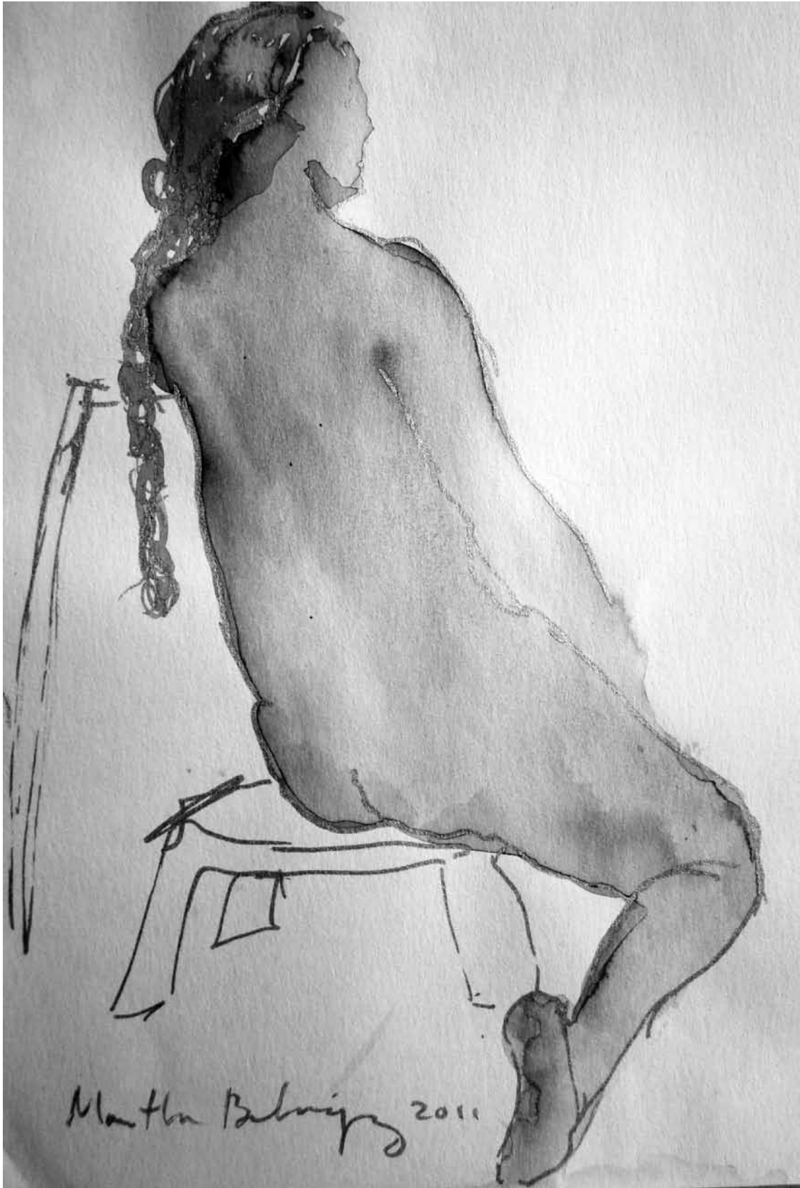
Sin título , dibujo serie Figura humana (pequeño formato), 2011 | MARTHA BOHÓRQUEZ