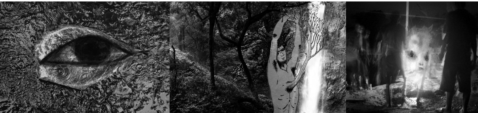
Cayapas-Atisba / Cascada de San Miguel / El Alabado | DAVID JARA COBO

Aunque no es definitivo que esté en los artistas la responsabilidad única de activar nuevas miradas del conflicto, sí existe un entramado histórico de imágenes producidas alrededor de éste que demandan una Historia, con mayúsculas; para aprender a verlo, ella permitirá que la imagen misma hable y sea interlocutora de los testimonios que allí reposan. Así las cosas, la relación entre cuerpo, arte y violencia en la escritura de la historia del conflicto armado en Colombia no será solamente el resultado de una sintonía con los debates con-