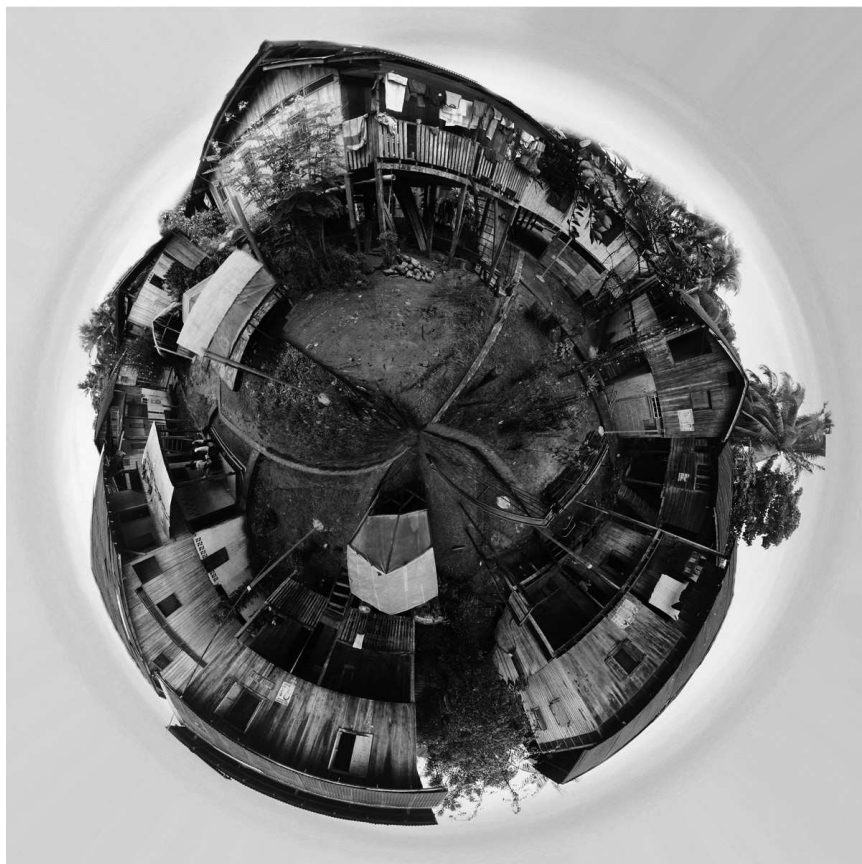
Zapallo Grande | DAVID JARA COBO

cen en los ríos, el silencio o el dolor, la ausencia del cuerpo y los consecuentes duelos pendientes son sólo enunciados en la descripción de las obras analizadas.