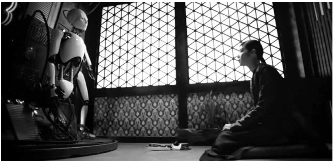
Doomsday Book , 2012 | DIRECTORES: KIM JEE-WOON Y YIM PIL-SONG