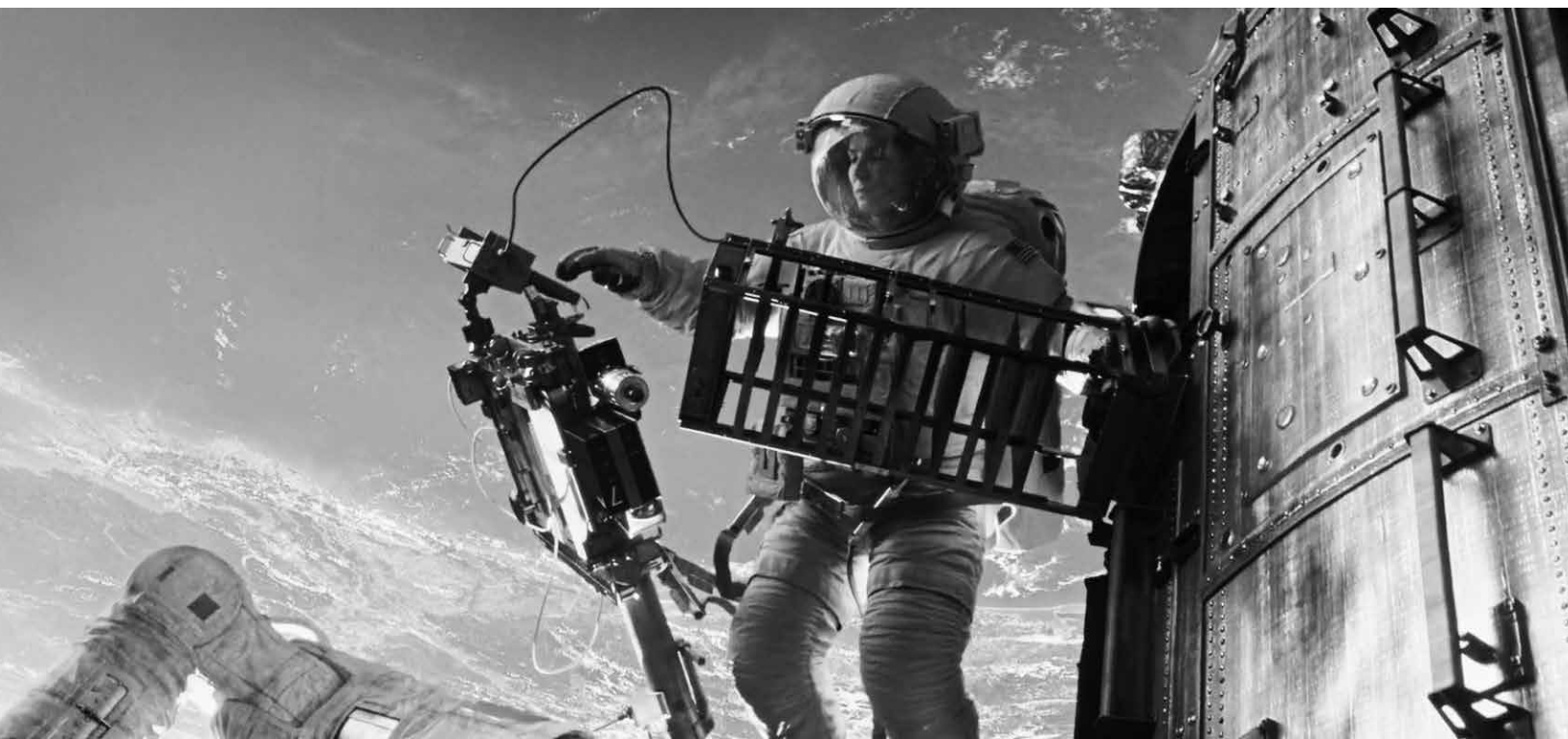
Gravity , 2013 | DIRECTOR: ALFONSO CUADRÓN

y políticas públicas esté marcada por una diferencia irreconciliable, como esferas autónomas, y tampoco podemos negar sus especificidades. Es a partir del ejercicio de esas mediaciones que los investigadores van a discutir los vínculos, los límites y las expectativas de los actores que son parte de esa relación. Tales diferencias exigen un esfuerzo de traducción para que haya un mínimo de inteligibilidad capaz de promover la apropiación y uso de las investigaciones en políticas públicas específicas. En la perspectiva de un economista entrevistado, “el personal del gobierno que debe ejecutar el presupuesto, rellenar formularios” habría tenido disposición a un mayor acercamiento, pero “la lógica de trabajo de los policy makers lo impide”, entendiéndose por esa “lógica” la dinámica cotidiana de los gestores, verbalizada como timing :