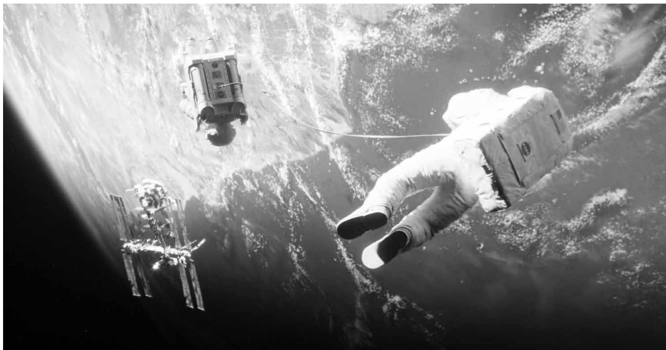
Gravity , 2013 | DIRECTOR: ALFONSO CUADRÓN

Pero no todos están de acuerdo en que el lenguaje es un problema. La especificidad del lenguaje científico es su expresión rigurosa y, como tal, debe mantenerse. Lo más importante para una investigadora-gestora es la