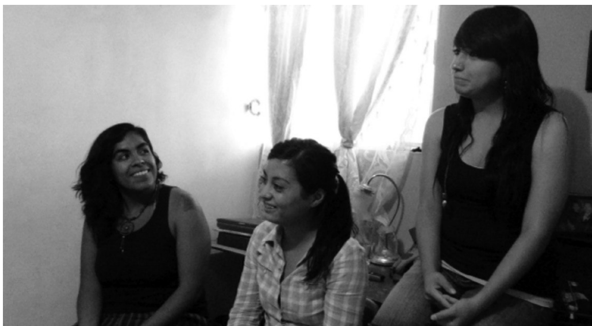
Imagen 1. Integrantes Batallones Femeninos

Fuente: fotografía Carolina Rosas Heimpel (octubre del 2013).