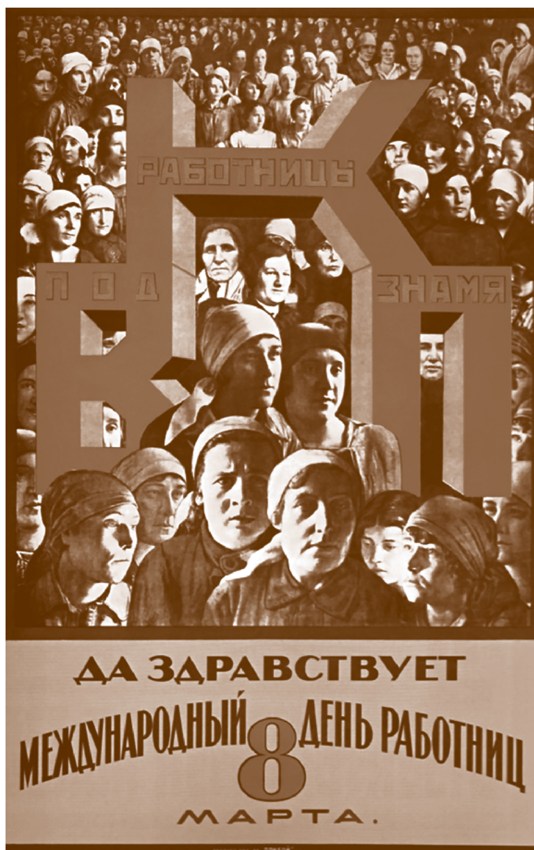
■ Mujeres Trabajadoras bajo la bandera del VKP (the All-Union Communist Party). Larga vida al día internacional de la mujer trabajadora, 8 de marzo, 1926 | Sin autor

Desde el siglo XV y hasta mediados del siglo XVII, los indígenas y los esclavos traídos de África, sin ser asalariados, generaron un excedente sobre el costo de producción de las mercancías que eran obligados a producir. Ese excedente, que proviene principalmente de la plata, el oro y de productos tropicales, se transfirió a Europa y se incorporó allí como ganancia, integrándose sin diferencia con el plusvalor producido por los asalariados europeos. De esta forma, sujetos productores comprados como mercancías, como cosas des-