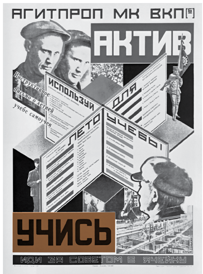
■ Estudia, sé activista. Pregunta a una célula si necesitas un consejo, 1927 | Gustav Klutsi

Supongamos que estamos a comienzos del siglo XVI en América, para entonces exclusivamente lo que hoy es América Latina. ¿Qué cosas encontraríamos en términos de las formas de control y de explotación del trabajo? Probablemente las siguientes cosas y probablemente en el siguiente orden: esclavitud, servidumbre personal, reciprocidad, pequeña producción mercantil y salario. Y todavía sin mencionar lo que se llama economía natural entre los economistas, ¿verdad? Cinco siglos después, ¿qué encontraríamos en América Latina y ahora en el mundo entero? De nuevo, probablemente las siguientes cosas, pero probablemente ya en