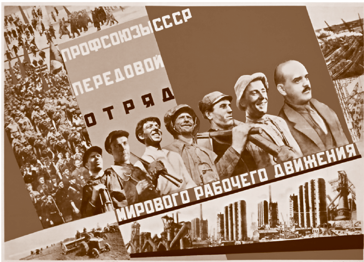
■ El Sindicato de la URSS es el gran destacamento de vanguardia del movimiento obrero mundial, 1932 | Sin autor

Para ello plantea establecer un precio “justo” para la tierra, que debe garantizar que el obrero tenga que trabajar para el capitalista un largo periodo de tiempo, el cual servirá para financiar la importación de más mano de obra asalariada antes de que el obrero pueda independizarse por completo.