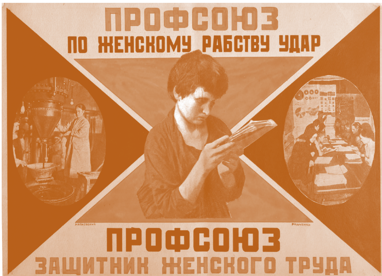
▪ El sindicato es un defensor de la labor femenina , 1925 | Alexander Rodchenko