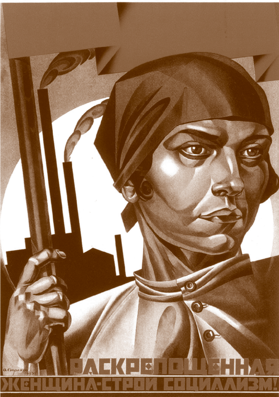
• Mujer liberada, ¡ayuda a construir el socialismo! , 1926 | A. I. Strahov-Braslavsky

reemplaza a otra, sino por el contrario, “cada una es un piso en una articulación jerarquizada de transferencia de recursos y de valor” (Quijano, 1989: 43). Es decir, que no sólo coexisten, sino que se combinan en una estructura global del capital.