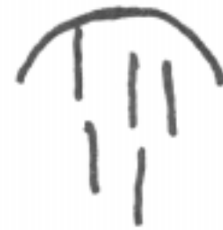
Varios trazos que descienden del cielo significan la «noche».

No será el fin sino la metamorfosis de la escuela.