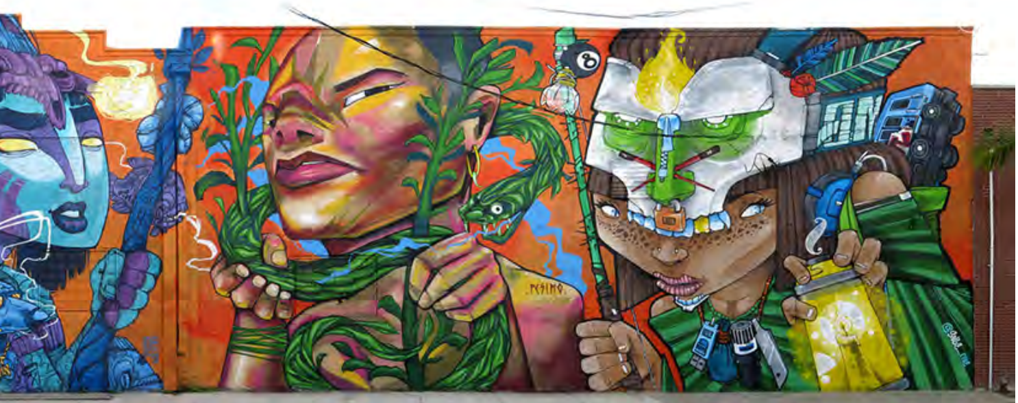
▪ Chamanes , Wynwood, Miami (Estados Unidos), 2016 | Pésimo

En esta sección final, examinaré una de estas fronteras del siglo XX, a saber: la que existe entre la ciencia dominante o de corriente principal ( mainstream science ) y la ciencia periférica; en otra parte he examinado con detalle la demarcación actual que ocurre en el marco de la emergente sociedad de la auditoría del primer