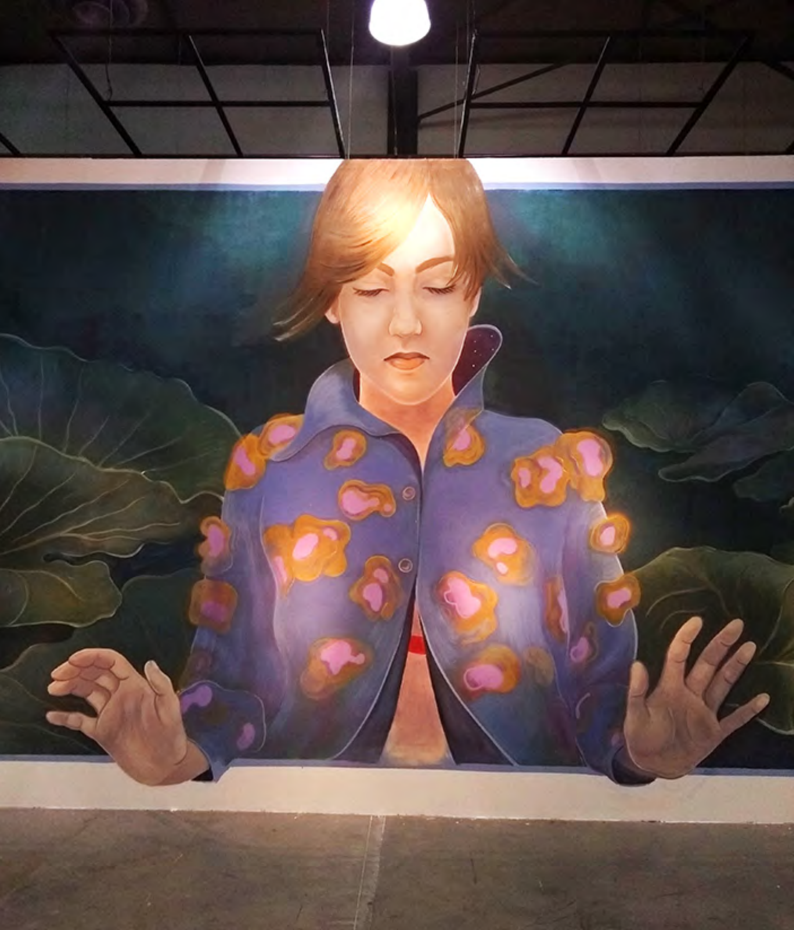
▪ Sopa de letras , participación en el festival Callegenera, Monterrey (México), 2018 | Fusca