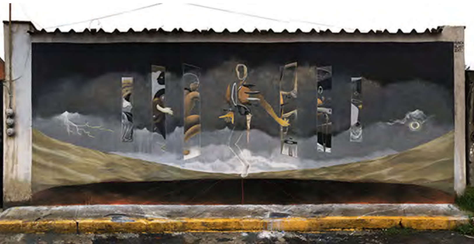
■ Sin título , colaboración con Blastuno, Cholula (México), 2017 | Fusca

Kronick, 1976 [1962]: 171). Una década antes, sin embargo, el abate rebelde Jean-Baptiste François Rozier, editor independiente del Journal de Physique , señalaba que, por el contrario, se necesitaban más revistas, pero de un tipo diferente a las publicadas por las sociedades y academias científicas. Muchas de las contribuciones al Journal de Physique fueron informes preliminares de documentos que habiendo sido presentados ante diversas sociedades científicas en Europa y Francia en particular, eran, sin embargo, publicados primeramente por el Journal de Physique y otras revistas independientes, como quiera que la difusión de las ideas por parte de las sociedades y academias no fue preocupación central de estas últimas durante buena parte los siglos XVII y XVIII. La Academia de Ciencias de París, por ejemplo, no publicó sus Memoirs regularmente sino hasta 1702, y la Real Sociedad de Londres sólo asumió responsabilidad por las Transactions hasta 1753 (Kronick, 1978; Houghton, 1975). Nuestro abate reclamaba, entonces, que se necesitaban más revistas para que el “progreso científico” no disminuyera su ritmo (citado en Kronick, 1978). Observamos aquí una nueva distinción entre las revistas independientes y las revistas académicas, que si bien no se diferenciaban por su scope generalista, sí intro-