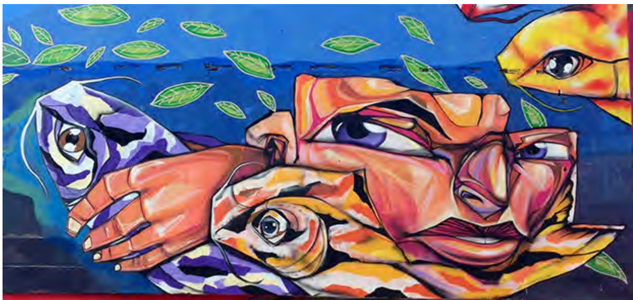
▪ Sin título (detalle), Lima (Perú), 2014 | Pésimo