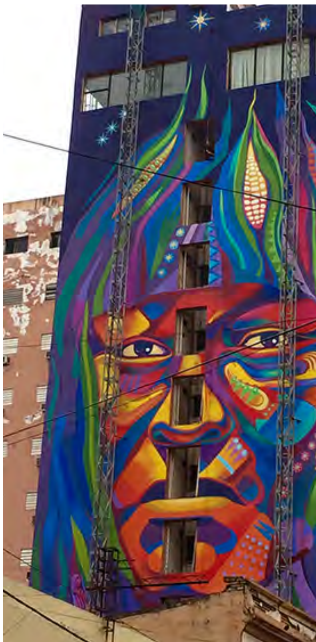
■ Androide volador , mural para Latidoamericano, Asunción (Paraguay), 2016 | Guache

ducían el tema de la autoridad del editor como fuente de credibilidad. Las publicaciones de las sociedades transmitían toda la credibilidad que había sido conferida por la sanción oficial, ya sea que la sociedad deseara reconocerlo o no. En cambio, no hubo una fuente de autoridad similar para las publicaciones periódicas iniciadas por individuos como fue el caso del Journal de Physique . La credibilidad o autoridad de la revista independiente derivaba del editor, quien, a veces, buscaba establecer sus credenciales relacionándose con una sociedad existente, como fue el caso de Henry Oldenburg, el primer edi-