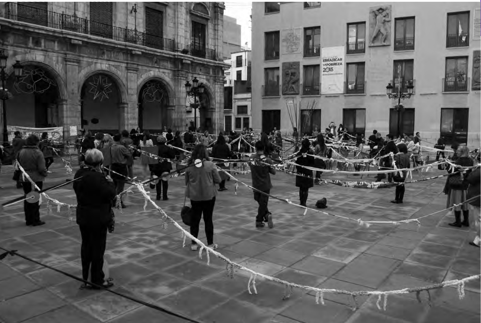
▪ Performance forjando una red sólida formal e informal de apoyo a las mujeres víctimas de la violencia, España, 2014