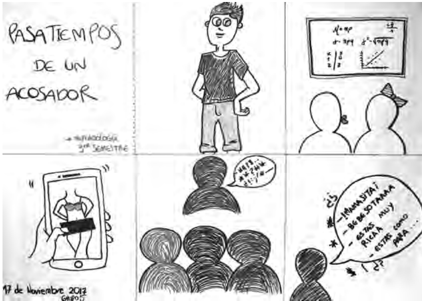
Imagen 3. Taller 14, estudiantes Facultad de Ciencias Administrativas, Económicas y Contables (FCAEC), 2017