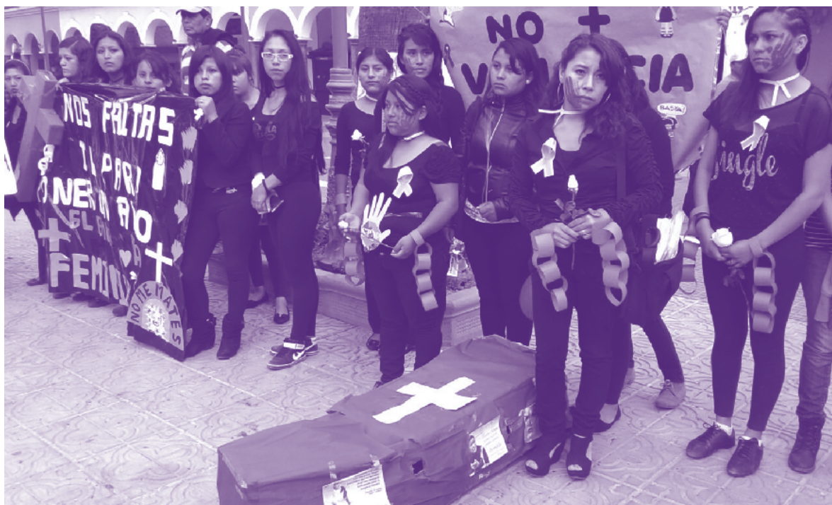
■ Mujeres se movilizaron en La Paz, Cochabamba y Santa Cruz para sumarse a la campaña #NiUnaMenos, Bolivia, octubre del 2016

varios, con los cuales ellas se sienten intimidadas. En ocasiones, los funcionarios saludan a estudiantes y trabajadoras de beso en la mejilla, les toman de la mano o las abrazan sin mediar ningún consentimiento. Este tipo de relacionamiento además es llevado a la virtualidad, les envían mensajes invitándolas a salir, de forma persistente.