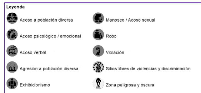
Figura 1. Íconos utilizados

La cartografía en ambas sedes fue bien valorada, hubo receptividad y apertura para participar. Algunas personas se sintieron atraídas por los mapas y se acercaron para conocer la actividad. Paralelo a la ubicación del hecho en el mapa, narraron algunos sucesos y discutieron y aprovecharon para hacer consultas de carácter personal. Los íconos utilizados fueron los siguientes (figura 1).