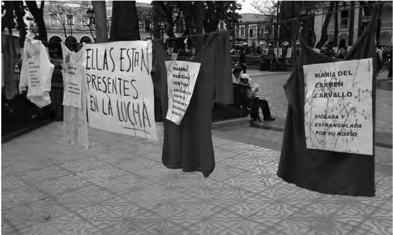
■ Mujeres se movilizaron en La Paz, Cochabamba y Santa Cruz para sumarse a la campaña #NiUnaMenos, Bolivia, octubre del 2016

contra las mujeres, la población con identidad de género y orientación sexual no hegemónica y, en general, todas las formas de expresión y de comportamiento consideradas como femeninas.