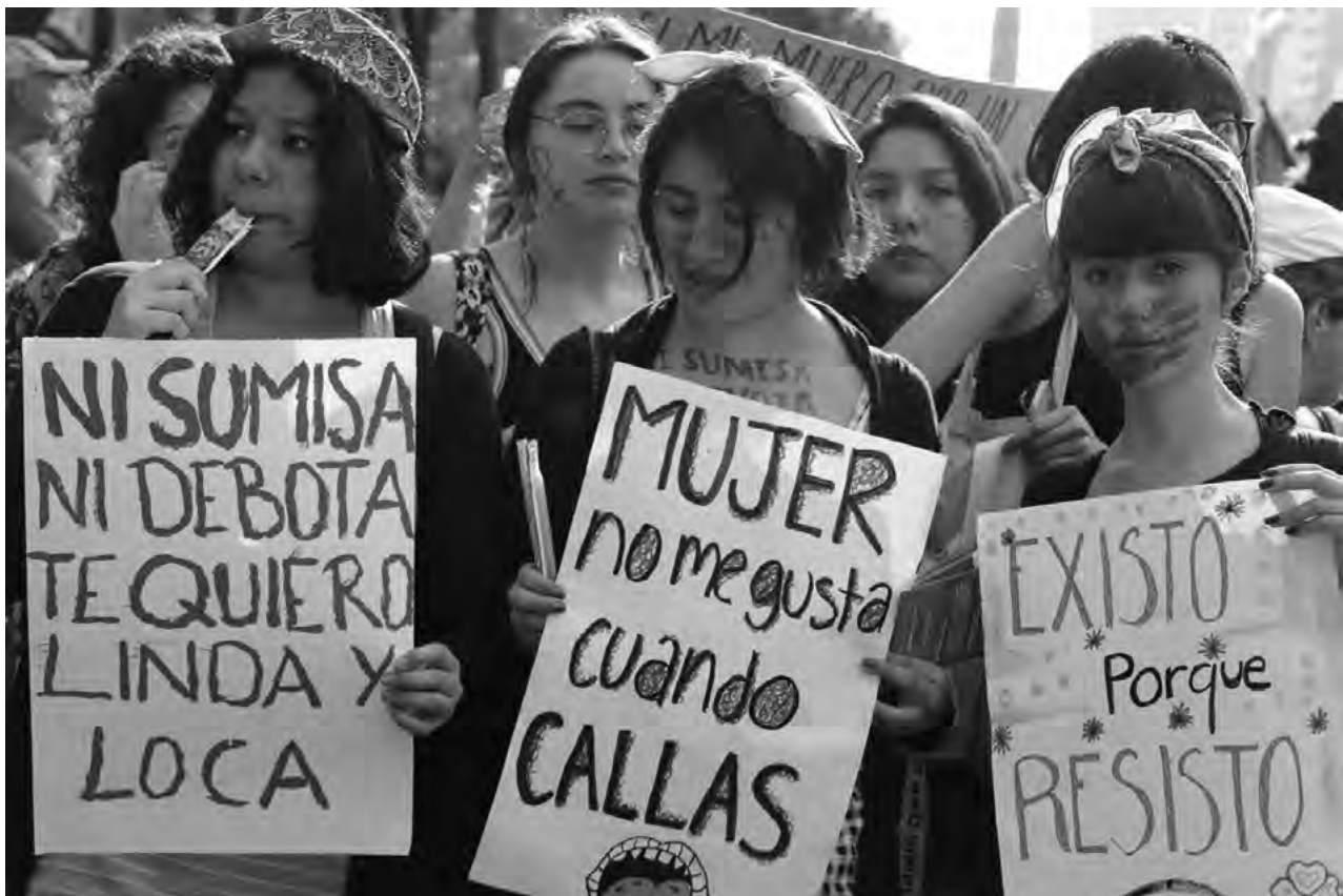
▪ Marcha en el Día Internacional de la Mujer por el fin de la violencia de género, las desapariciones y en defensa de sus derechos, México, marzo del 2019

Los sitios seguros o libres de violencia y discriminación en San Fernando tienen 37 registros (13,7%). Están ubicados en la parte central de la sede: los edificios (29), la Plazoleta Palau (2) y los senderos peatonales (6). Los espacios seguros se ubican dentro de las facultades, donde hay mayor afluencia de estudiantes y docentes, además de las zonas comunes como la biblioteca, la cafetería y el edificio de administración, de uso académico principalmente. Estos espacios sociales tienen que configurarse como un lugar de disputa del poder, de lo público, de lo personal, de lo social y de lo simbólico, son un producto socialmente construido y, por lo tanto, con potencialidad de ser transformados (Lefebvre, 2013).