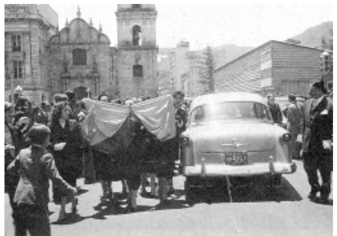
Marcha de mujeres, Bogotá, 1953.

El eslogan del gobierno del General Rojas rezaba, «Paz, justicia y libertad para todos los colombianos». Es