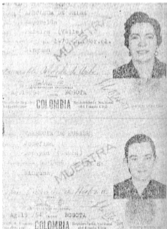
EL ESPECTADOR - Sábado, agosto 28-1954.