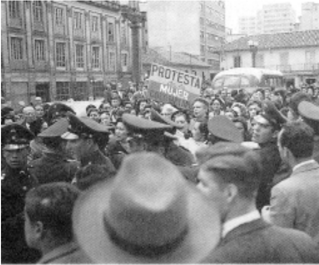
Marcha de Mujeres, Bogotá, 1953.