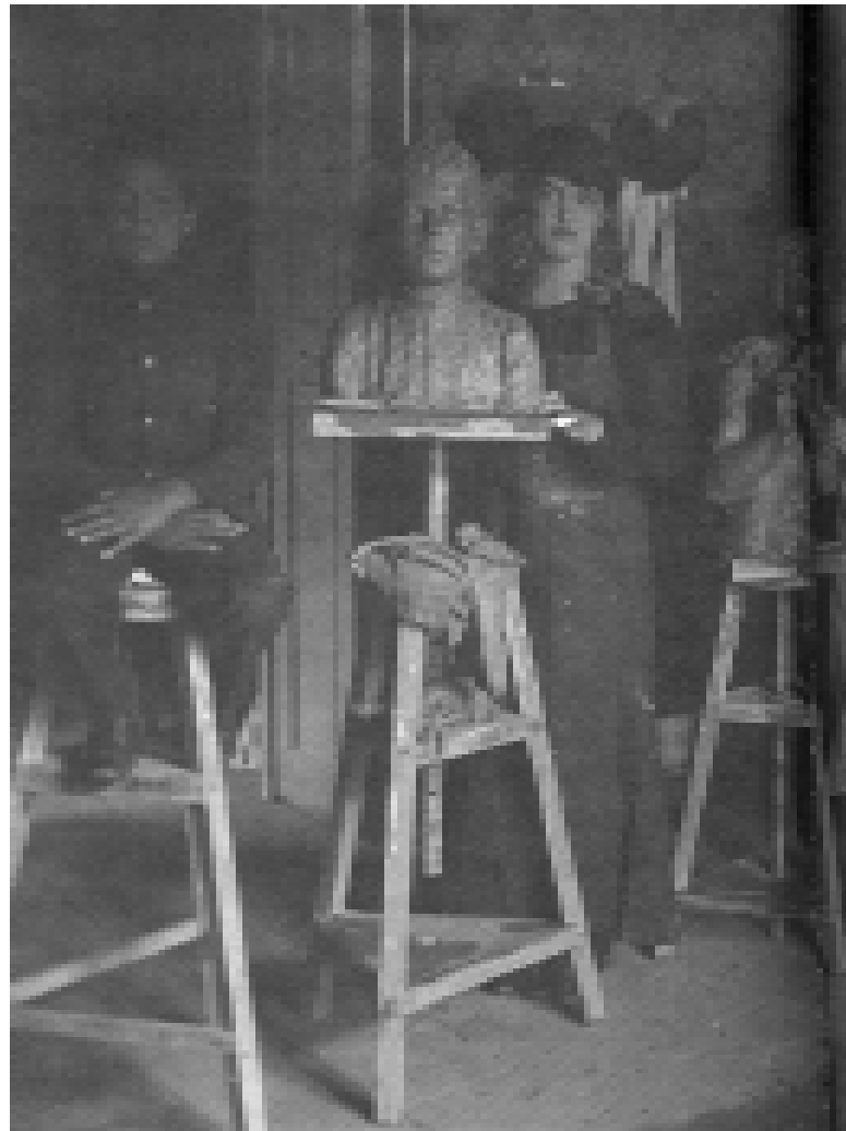
Clase de Escultura