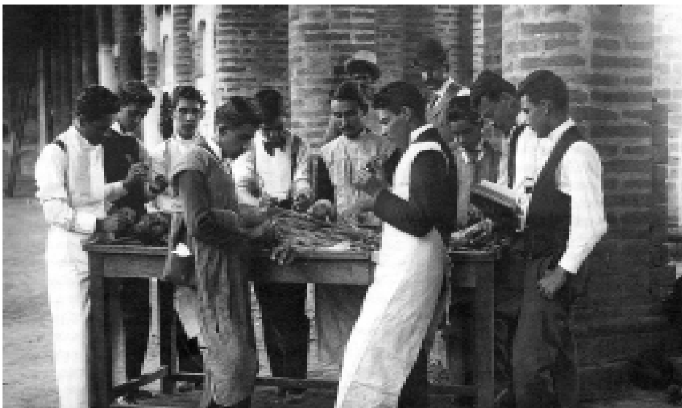
Estudiantes de Medicina, 1892.

Por ser estudios pioneros, en gran parte de carácter exploratorio, la mayoría de las investigaciones se ha enfrentado al desafío de conocer y analizar qué significa ser varón y qué consecuencias acarrea el serlo en el contexto latinoamericano. En efecto, el principal tema en los trabajos analizados es el de la construcción de la identidad masculina. Entre los principales estudios que buscan responder estos interrogantes podemos citar el de Rafael L. Ramírez, “Dime capitán: reflexiones sobre la masculinidad”