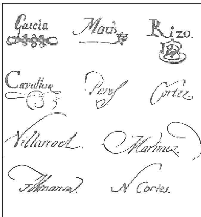
Firmas de los dibujantes de la Expedición Botánica